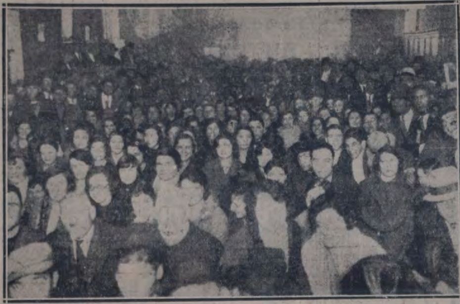
OBROS Y OBRERAS DE LA COMPANIA FABRIL FINANCIERA EN UNA DE SUS DIARIAS ASAMBLEAS realizadas en el Centro Socialista de la sección 3a., Montes de Oca 1685.

Ayer ha tomado posesión de su cargo el nuevo presidente del Departamento Nacional del Trabajo; él tiene la palabra para poner fin a esta situación anormal para bien de la industria y de tres mil trabajadores que desde hace dos meses están sosteniendo una lucha cruenta, con el consiguiente perjuicio para su ya escasa economía."